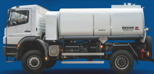
Cisterna za gorivo